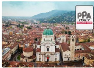
Del 5 al 9 de enero de 2027 BRESCIA, ITALIA