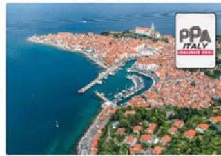
Del 22 al 26 de julio de 2026 PORTOROŽ, ESLOVENIA